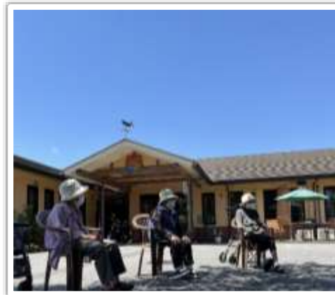
真っ青な空の下で ラジオ体操

高齢者介護施設 宝夢は6月1日に開設15周年を迎えます。10周年のお祝いをした時は、新型コロナに追われる5年間になるとは予想もしていませんでした。一日一日を楽しめることがどれだけ貴重なことなのかを思い知った5年間となりました。新型コロナの脅威は継続していますが、利用者様の生活の質と感染対策の両立を図りながら支援していきたいと思えます。これからも高齢者介護施設 宝夢をよろしくお願いたします。