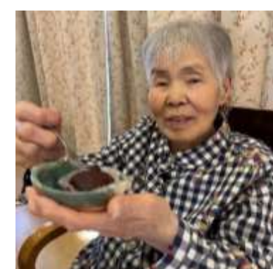
彼岸にはあんこたっぷり ぼたもち