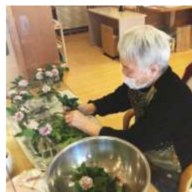
沈丁花の香りがホールに満ちます