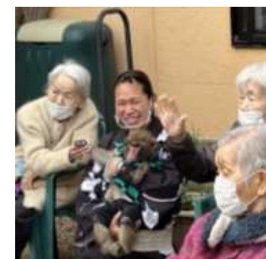
すっかり利用者様の人気者