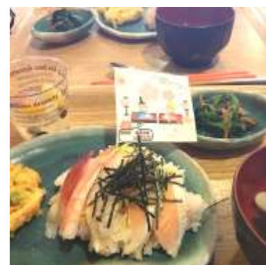
ひな祭りのランチはちらし寿司