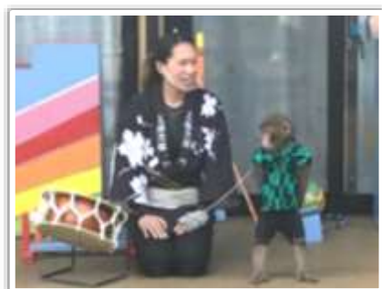
日光さる軍団が 宝夢に来てくれました！

新型コロナウイルスは感染者の減少傾向はみられているものの、まだまだ高止まりの状況。しかし、まん延防止等措置が解除になり、桜の開花の便りも聞かれ始め、春の陽気に誘われて、屋外での活動が楽しみになってきます。まずは、毎年恒例、宝夢の桜の下での散歩、体操、ランチ、おやつと毎日、花見に忙しい日が待っています。コロナ禍3年目の春も楽しんで行きたいと思えます。