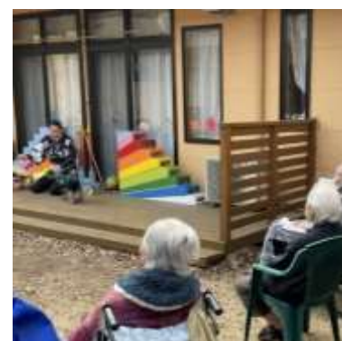
中庭の特等席で声援を送ります