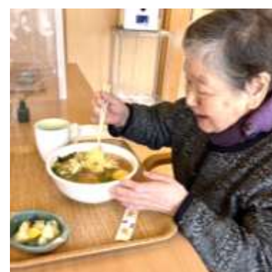
移動ラーメンに笑顔がこぼれます