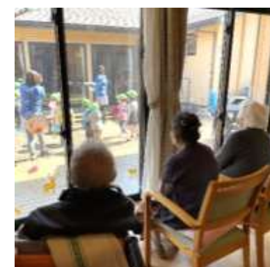
幼稚園児のダンスに拍手喝采