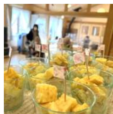
今日の手作りおやつは何か？