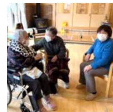
いくつになっても楽しい女子会