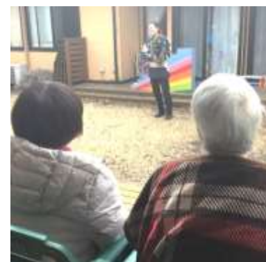
猿のゆう君の演技に泣き笑い

感染対策が優先となってしまう生活も早3年。コロナ禍でも楽しんでもらいたいという気持ちは変わらず。「感染対策」と「日常を楽しむ」を持続可能な両立をさせるために、春を迎える3月も宝夢では工夫を凝らしています。