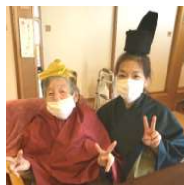
いつもよりすまし顔のお雛様