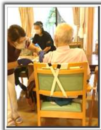
コロナワクチン 1回目

ワクチン接種が進み、アフターコロナへの期待感が高まりますが、デルタ株、果てはデルタプラスという変異株のニュースは感染対策の継続の必要性を感じさせます。笑ってアフターコロナを迎えられるように、ワクチン接種で感染対策を緩めることなく、コロナ禍を過ごしていきたいと思ひます。