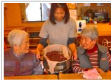
令和初めての新年 お赤飯で祝います

これから1年で一番冷え込む2月を迎えます。しかし、徐々に強さを取り戻してくる太陽の光に春が少しずつ近づいてきていることを感じるができると思います。2月も一日一日を大事に過ごし、食べて、出掛けて、笑って、楽しんで、寒い冬を元気に乗り切りたいと思います。