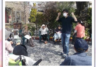
桜吹雪 桜のじゅうたんの 中での体操