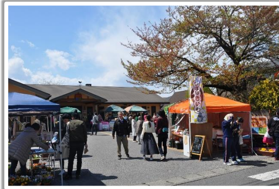
たかねざわマルシェ ご来場ありがとうございました

来年も利用者様と一緒に春を満喫できるように、今年も宝夢での生活を楽しんでもらいたいと強く感じました。