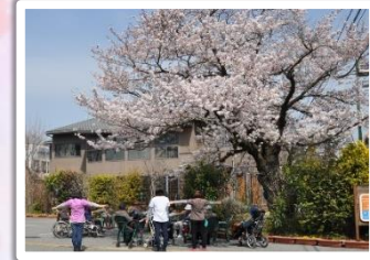
満開! ラジオ体操 気分爽快!