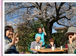
午後のおやつを 桜の下で ゆったりと