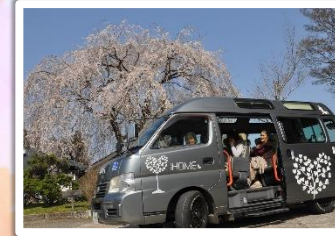
桜を求めて ドライブ