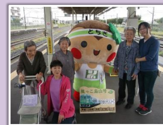
烏山線 風っ子号乗車