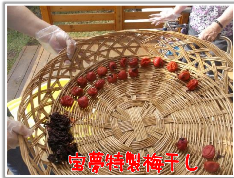
宝夢特製梅干し できました!

9 月は朝夕は涼しくなりますが、一日の気温の大きい変化や、夏の疲れがでてきて体調を崩しやすくなる時期ですが、食欲を刺激する秋の到来でもあります。疲れを吹き飛ばすように、ぶどう狩りなど、実りの秋を満喫する予定です。ドライブでコスモスや黄金の田んぼを見たりとより積極的に外出し、季節を楽しんでもらいたいと思っています。